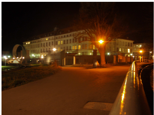
Naše škola v Kremsu