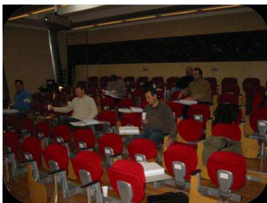
...učit se...učit se...učit se...