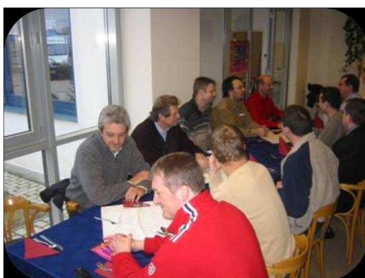
Návštěva Ipari Park Győr