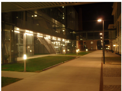
Školní promenáda na Donau Universität Krems