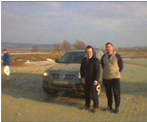
Po zkušební jízdě ve VW Touareg